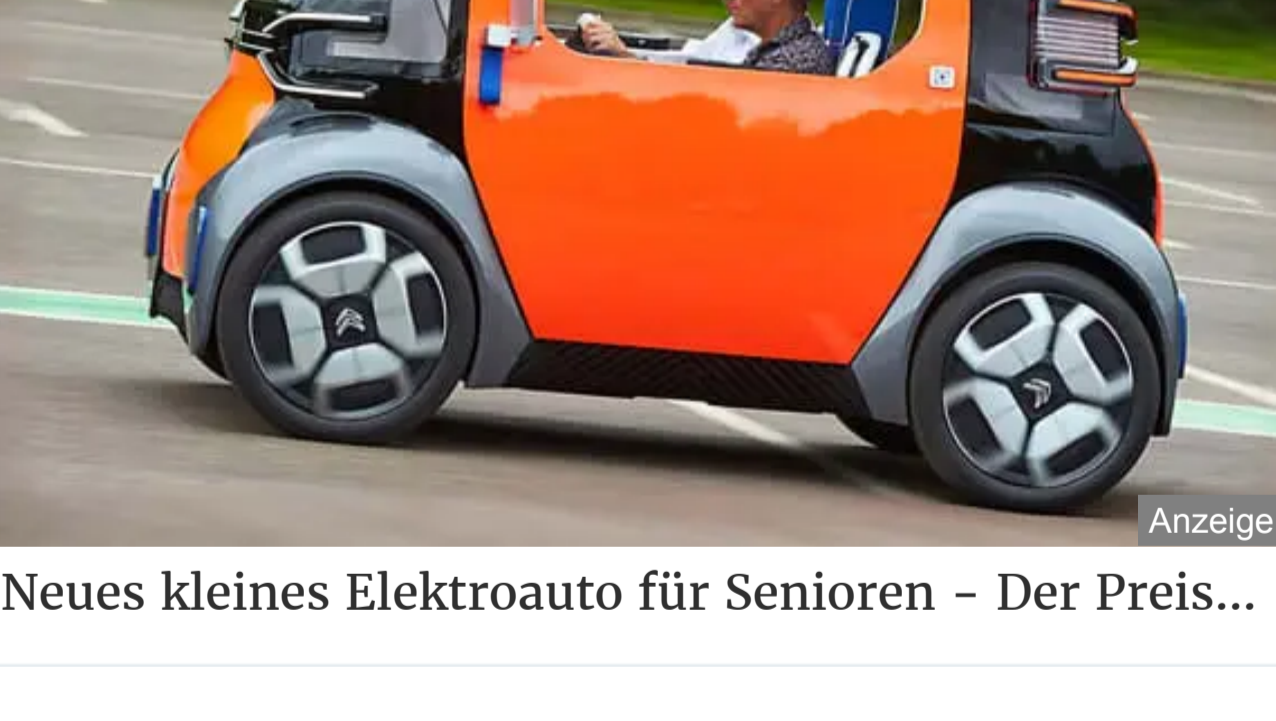
Neues kleines Elektroauto für Senioren - Der Preis...