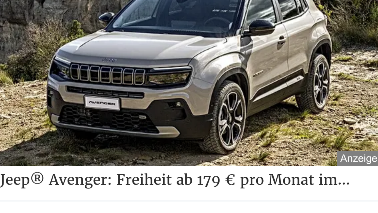
Jeep® Avenger: Freiheit ab 179 € pro Monat im...

Sein „herzlicher Dank“ gelte „ausdrücklich den zahlreichen Unternehmen, der IHK und der Bergischen Universität Wuppertal und nicht zuletzt auch den Mitgliedern des Verwaltungsrates der Wirtschaftsförderung, die in ihrer Gesamtheit und mit ihrer Expertise in vielen Workshops und Lenkungsgruppensitzungen zu diesem erfolgreichen und richtungweisenden Ergebnis beigetragen haben.“