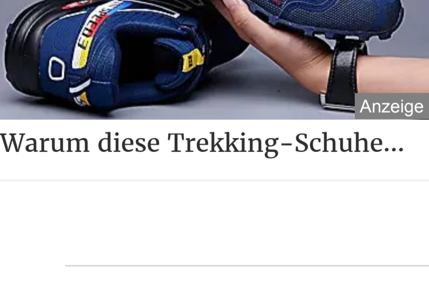
Warum diese Trekking-Schuhe...