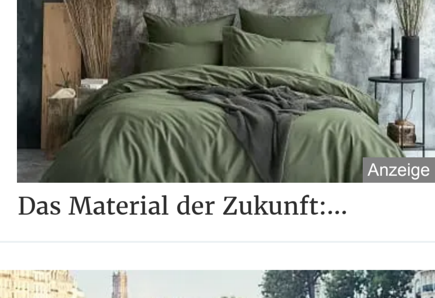
Das Material der Zukunft:...