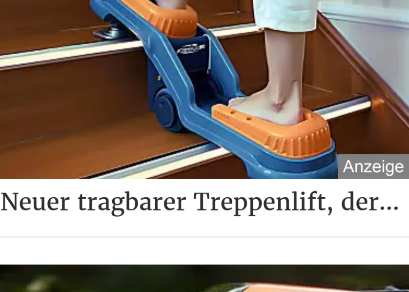
Neuer tragbarer Treppenlift, der...