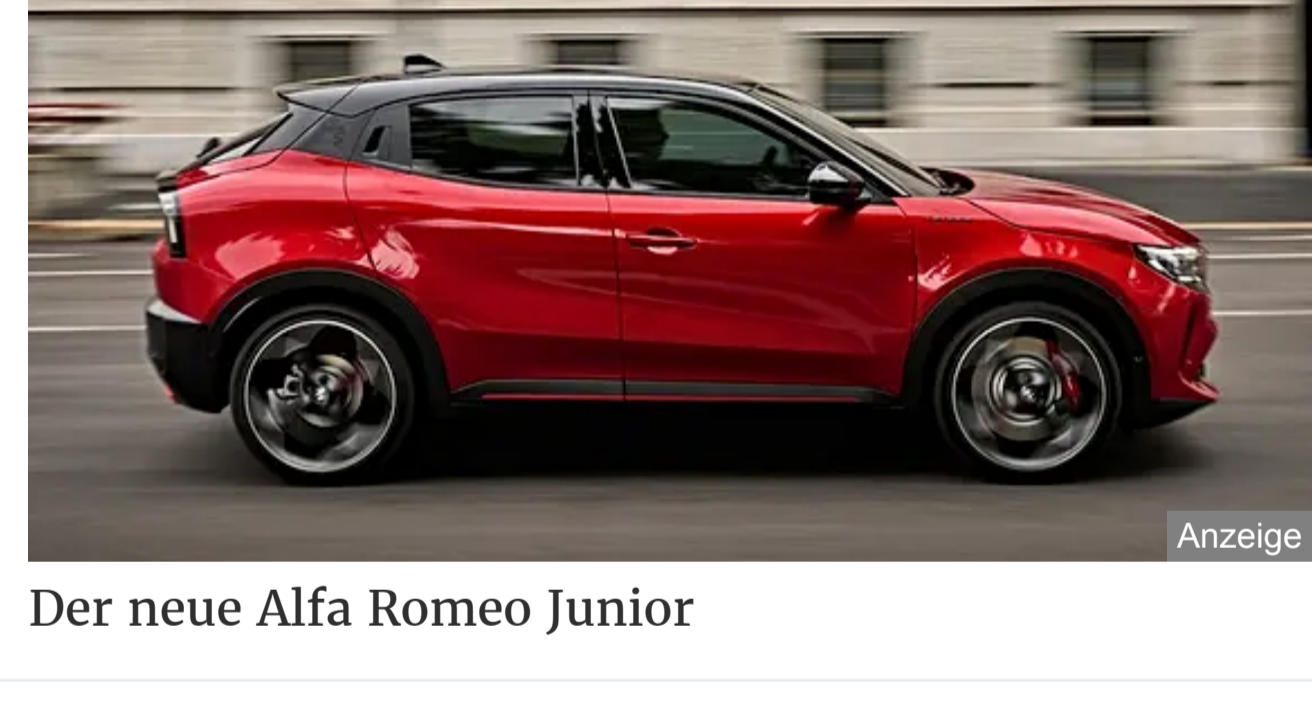
Der neue Alfa Romeo Junior