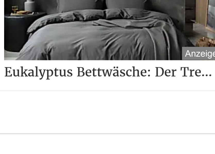
Eukalyptus Bettwäsche: Der Tre...