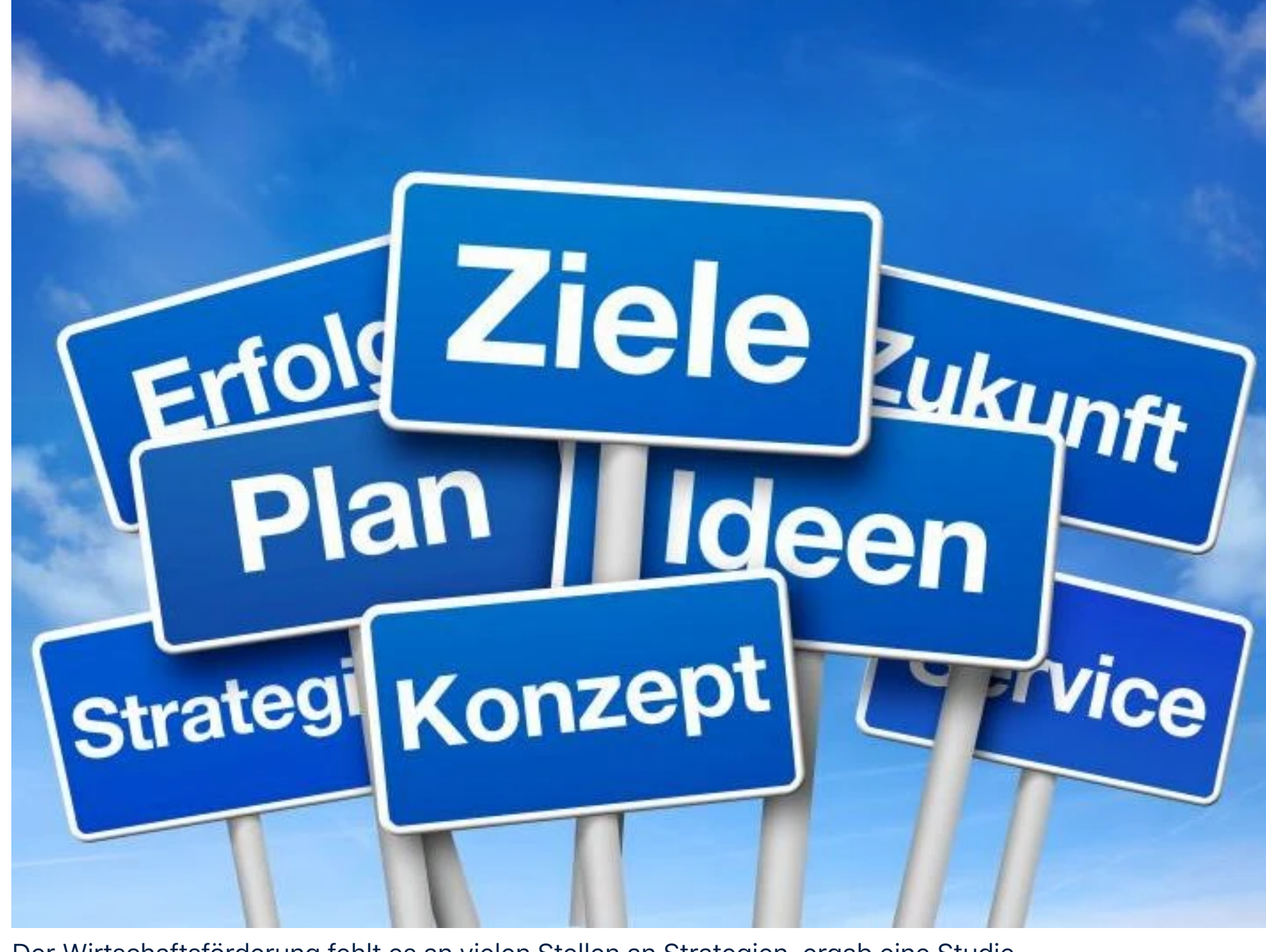
Der Wirtschaftsförderung fehlt es an vielen Stellen an Strategien, ergab eine Studie.

Die Ergebnisse der Studie „Zukunft Wirtschaftsförderung 2023“ lassen die Alarmglocken schrillen. Insgesamt 340 Wirtschaftsfördernde gaben dabei Einblicke. Oft fehlen Strategien.