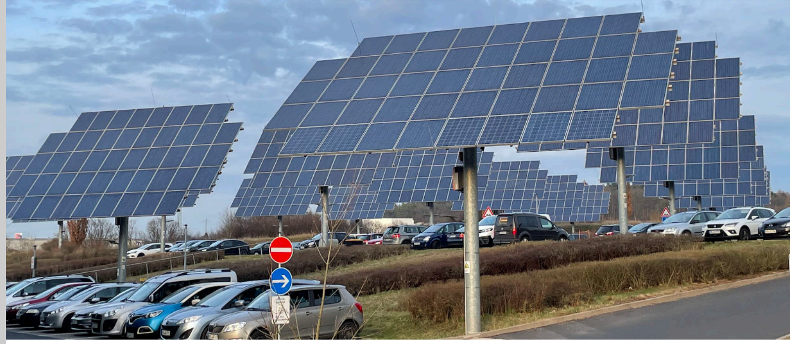
drehbare Solarfelder auf einem Firmenparkplatz in Bad Hersfeld

nachhaltiges Gewerbeflächenmanagement ist eine entscheidende Aufgabe der Verantwortlichen für einen Wirtschaftsstandort. Ohne das Vorhalten von Flächen für wichtige Unternehmen droht deren Abwanderung. Doch wer ist wichtig und wie können die Gewerbe- und Industrieflächen selbst nachhaltig gestaltet werden? Lesen Sie unsere Beispiele und besuchen Sie die angebotenen Seminare. Sie beleuchten dieses Kernthema der Wirtschaftsförderung auf verschiedene Weise.