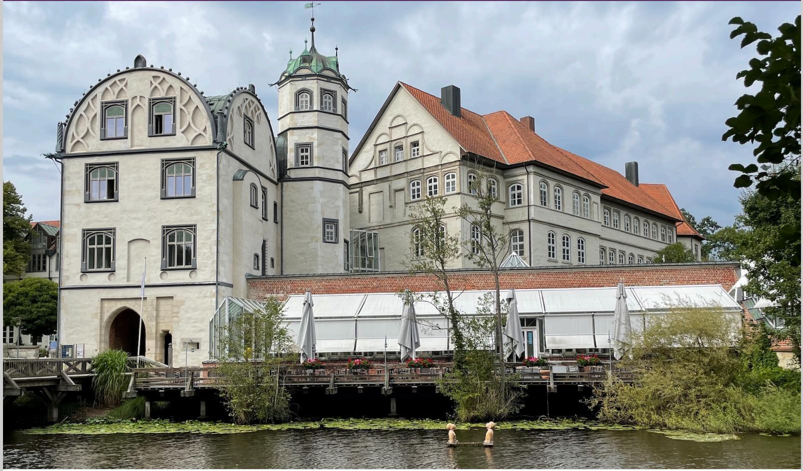
Das ehemalige Schloss in der Stadt Gifhorn ist Sitz des Landratsamtes. Hier fanden auch der Positionierungsworkshop und die Abschlussveranstaltung der Landkreis-Wirtschaftsförderungstrategie statt.