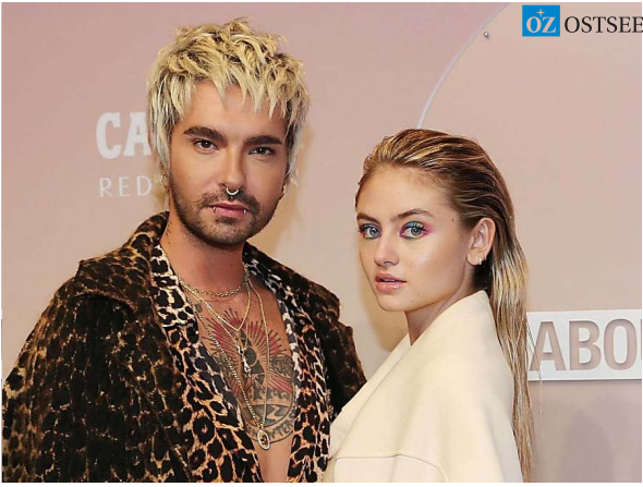
inTouch Bill Kaulitz & Leni Klum: Jetzt soll es jeder wissen!