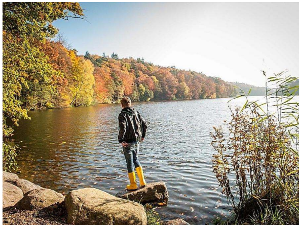
Mölln: der Indian Summer in Schleswig-Holstein Man muss nicht den Atlantik überqueren, um den Indian Summer zu erleben. Auch in Schleswig-Holstein laden bunte Wälder rund um die...