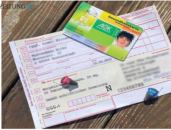
Hören heute München in Aufregung: Das zahlt die Krankenkasse beim Hörgeräte-Kauf